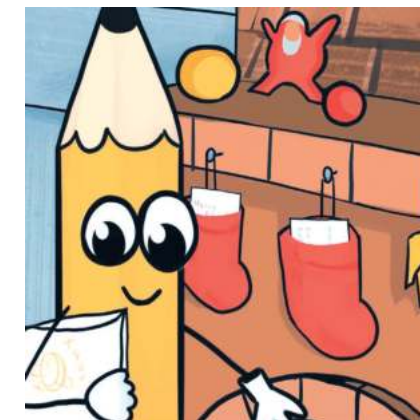
Діана Ваціліна, Аг 9-3