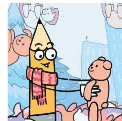
Валерія Костенко, АГ 9-4