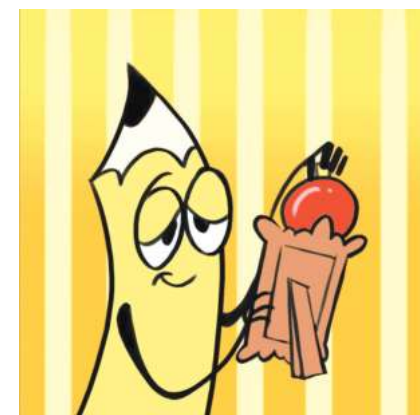
Анастасія Кравець, АГ 9-3