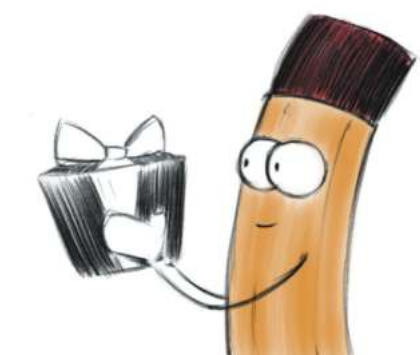
Яна Трейтяк, АГ 9-3