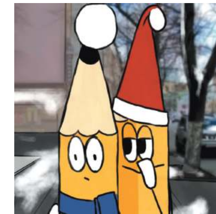
Марія Прищепя, АГ 9-3