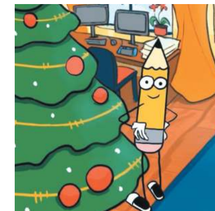
Влада Шевченко, АГ 9-3