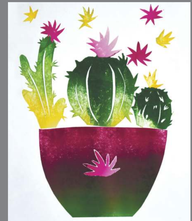
3 місце: Дар'я ЦАЛЬЦАЛКО (ДГ-9-19)