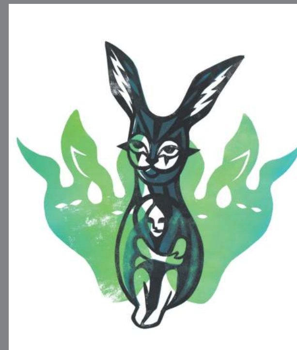
1 місце: Олена ЯРОШЕВЕЦЬ (ДГ-9-19)